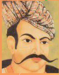
राजा राव तुलाराम