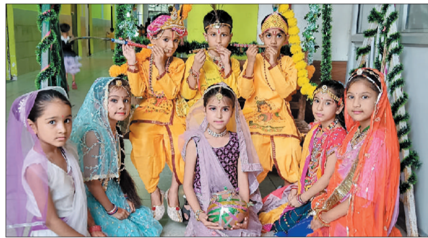
रेवाड़ी। स्कूल में जन्माष्टमी का पर्व मनाते हुए बच्चे।