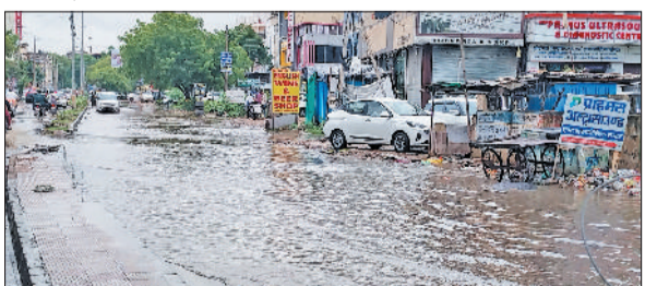
रेवाड़ी। वीरवार को हुई बरसात से जलमन अनाजमंडी, वीरवार को हुई बरसात से बावल रोड पर जलभराव।

वाली गर्मी का असर काफी कम हो गया। मौसम विभाग के अनुसार लगभग एक सप्ताह तक मौसम इसी तरह का बना रह सकता है। 15 अगस्त को आसमान में बादलों के बीच हल्की से मध्यम बारिश होने की संभावना है। अगले तीन-चार दिनों तक बरसात या बूंदबांदी होने के आसार हैं। इस दौरान तापमान में मामूली उतार-चढ़ाव