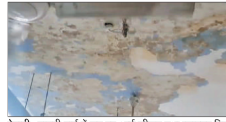
रेवाड़ी। गायनी वार्ड में छत पर आई सीलन तथा प्लास्टर गिरने के बाद खाली कराया गया वार्ड।