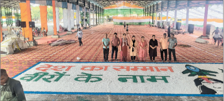
रेवाड़ी। स्वतंत्रता दिवस समारोह के लिए तैयार किया गया पांडाल।