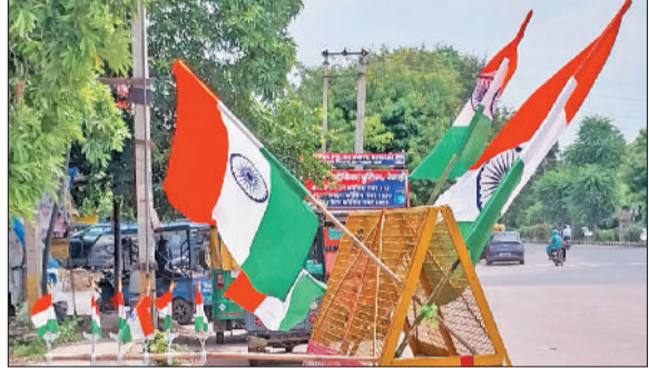
रेवाड़ी। स्वतंत्रता दिवस की पूर्व संघ्या पर राजेश पायलट चौक के पास सजे तिरंगे झंडे, तिरंगे के रंग में सजाई गई नई अनाजमंडी।