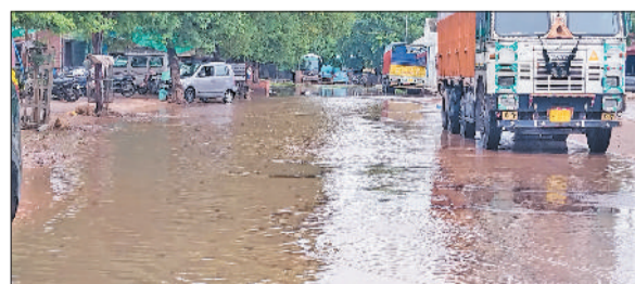
रेवाड़ी। वीरवार को हुई बरसात से जलमन अनाजमंडी, वीरवार को हुई बरसात से बावल रोड पर जलभराव।

मौसम ने एक बार फिर करवट ले ली। आसमान में बादलों के बीच रुक-रुककर बारिश होती रही, जिससे उमस भरी गर्मी का असर कुछ हद तक कम हो गया। तापमान में गिरावट दर्ज की गई। अभी मौसम साफ होने की संभावना नहीं है। एक सप्ताह तक आसमान में बार-बार बादल छांटे व बूंदबांदी से लेकर हल्की बरसात तक की संभावना जताई जा रही है। वीरवार को सुबह से ही आसमान में गहरे बादल छाए रहे। सुबह लगभग 8 बजे ही बादलों के