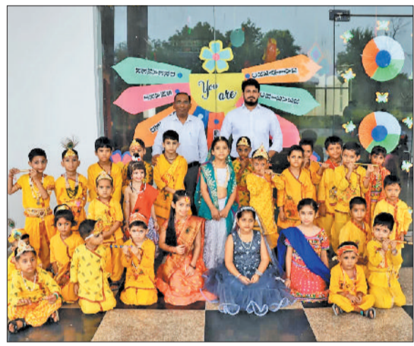
रेवाड़ी। स्कूल में जन्माष्टमी का पर्व मनाते बच्चे।

फोड़ प्रतियोगिता और भजन-कीर्तन कार्यक्रम में सभी विद्यार्थियों ने उत्साहपूर्वक भाग लिया। इस मौके पर प्रधानाचार्या ने कहा कि स्वतंत्रता दिवस हमें देश के प्रति समर्पण की प्रेरणा देता है, वहीं जन्माष्टमी हमारे सांस्कृतिक और आध्यात्मिक मूल्यों को संजोने का अवसर प्रदान करती है। सभी शिक्षक व विद्यार्थी मौजूद थे।